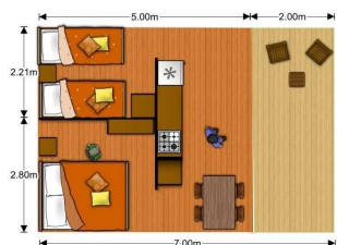
Tente Ecolodge 4 Places (25 m²) + Terrasse Couverte (10 m²)

L'équipement des Mobil-Home et des Tentes Ecolodge figure sur l'inventaire. La fourniture d'eau, gaz et électricité est comprise dans la location. Il n'y a pas de sanitaire ni d'eau courante dans les Tentes Ecolodge.