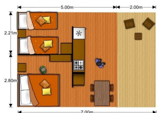
Tente Ecolodge 4 Places (25 m²) + Terrasse Couverte (10 m²)

L'équipement des Mobil-Home et des Tentes Ecolodge figure sur l'inventaire. La fourniture d'eau, gaz et électricité est comprise dans la location. Il n'y a pas de sanitaire ni d'eau courante dans les Tentes Ecolodge.